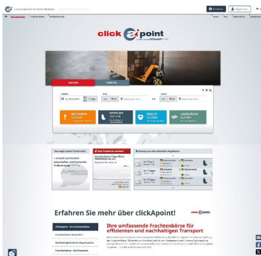
Abb. 01: Gemeinsam unterwegs: Die Mitfahrzentrale von clickApont vernetzt Fahrer und Mitfahrer für wirtschaftliche und umweltfreundliche Fahrten.

Bildmaterial: © GPSoverIP | Abdruck honorarfrei - Belegexemplar erbeten.