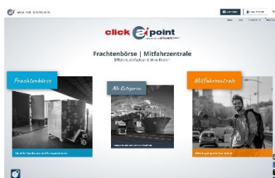
Abb. 02: Auf der clickApont-Plattform können Nutzer europaweit Frachten, Mitfahrgelegenheiten, Ladeflächen oder Sitzplätze ganz einfach suchen oder anbieten – kostenlos, intuitiv und ohne Registrierungshürden.