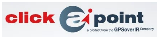
Abb. 04: Logo Frachtenbörse clickApont – A product of GPSoverIP