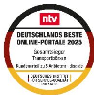
Abb. 05: clickApont wurde 2025 vom Deutschen Institut für Service-Qualität (DISQ) und ntv als bestes Online-Portal in der Kategorie Transportbörsen ausgezeichnet..